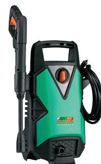
CLEAN BOY 110