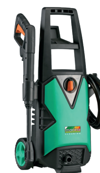
CLEAN BOY 130